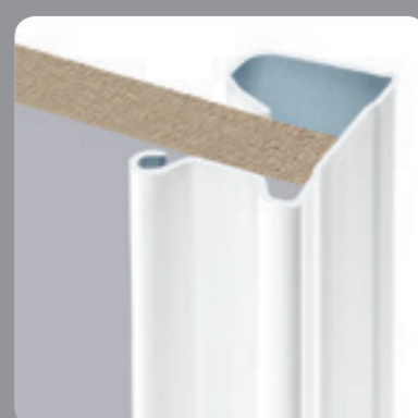
Profil en acier laqué traité anti-corrosion