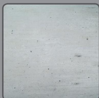
Panneau PPSM** décor béton, épaisseur 10mm

Ce pack contient : 2 portes coulissantes prêtes à installer + 1 rail haut et 1 rail bas