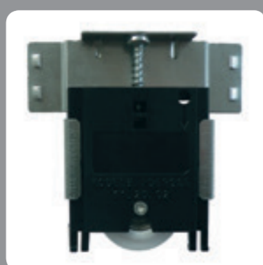
Confort d'utilisation : guide bas sur roulement à billes avec système anti-déraillement