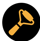
rouleau de compression

Sous réserve de changements techniques. Cette feuille technique remplace toute autre version. Notre garantie ne concerne que la qualité irréprochable de nos produits. Les données concernant consommation, quantité et exécution ne sont que des valeurs de référence. En cas de grave écart ces valeurs ne peuvent pas être reprises en tant que telles. Tous droits réservés.