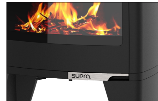
Une poignée intégrée pour un design épuré (Paul, Paul haut, Paul bûcher et Paul sur pied).