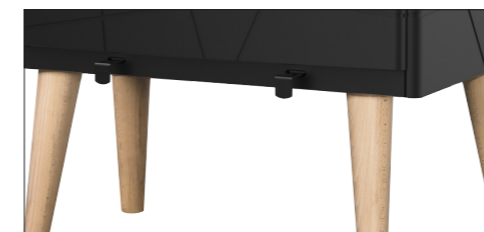
Un style scandinave avec ses pieds en bois