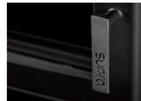
Une poignée ergonomique adaptée à une utilisation quotidienne.