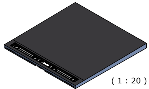
(1 : 20)

Zeichnungsnummer drawing number Z 00 00 60 73