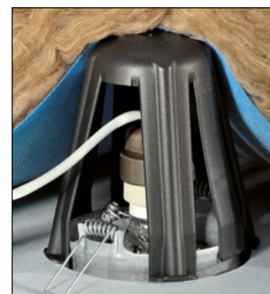
Optimisation des 4 pieds de fixation.