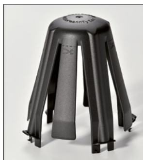
SpotClip-II – 4 pieds de fixation + 4 languettes flexibles sécables.