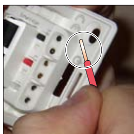
4. Mesurer la longueur des fils à dénuder en utilisant le gabarit intégré au produit (11mm)