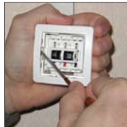
2. Enlever le cadre par l'intérieur