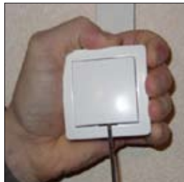
1. Démontez l'enjoliveur