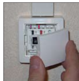
7. Encliquer le cadre et l'enjoliveur