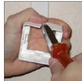
3. Découper le cadre en utilisant les pré-découpes