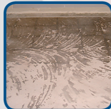
RÉSIDUS DE COLLE