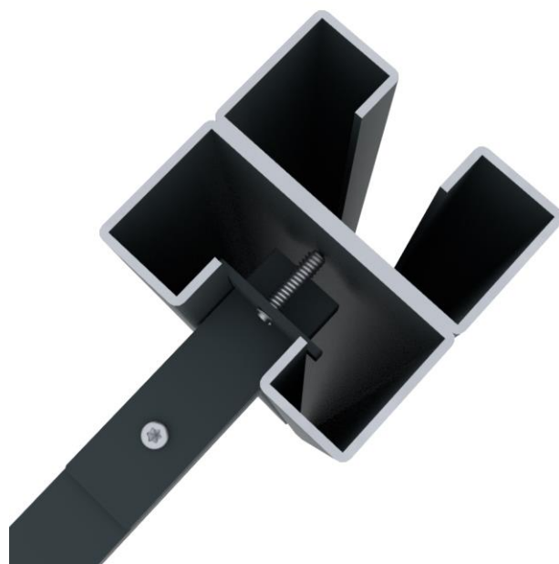
Poteau acier 70x70mm

ATTENTION : Le rail haut doit être fixé en laissant un jeu de 5mm minimum en fond de gorge du poteau