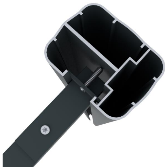
Poteau aluminium 50x65mm