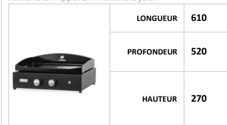
Annexe 1 : Appareil Plancha 2 feux