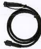
Rallonge (existe en 1m ou 2,5m) DEC/R1M-24ET - DEC/R2M-24ET