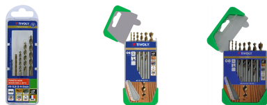
5 forets bois speed point Ø 2 à 5mm 6 forets bois speed point Ø 2 à 8mm 8 forets bois speed point Ø 2 à 10mm