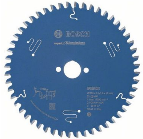
Image du produit, non emballé