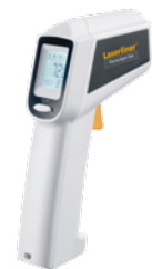
ThermoSpot One + piles