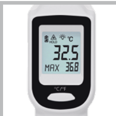
Afficheur rétroéclairé à cristaux liquides