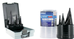
3 forets étagés HSS revêtus TiAIN Ø 4 à 30mm 3 forets étagés HSS revêtus TiAIN Ø 4 à 37mm