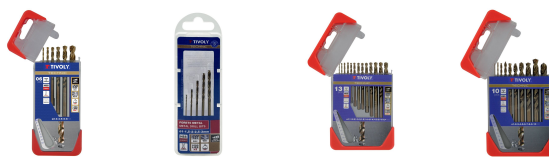
6 Forets métaux HSS-E5 (Cobalt 5%) gradués SLR pointe en croix Ø 1 à 8mm 5 forets métaux HSS-E5 (Cobalt 5%) gradués SLR pointe en croix Ø 1 à 3mm 13 forets métaux HSS-E5 (Cobalt 5%) gradués SLR pointe en croix Ø 1,5 à 6,5mm 10 forets métaux HSS-E5 (Cobalt 5%) gradués SLR Ø 1 à 10mm