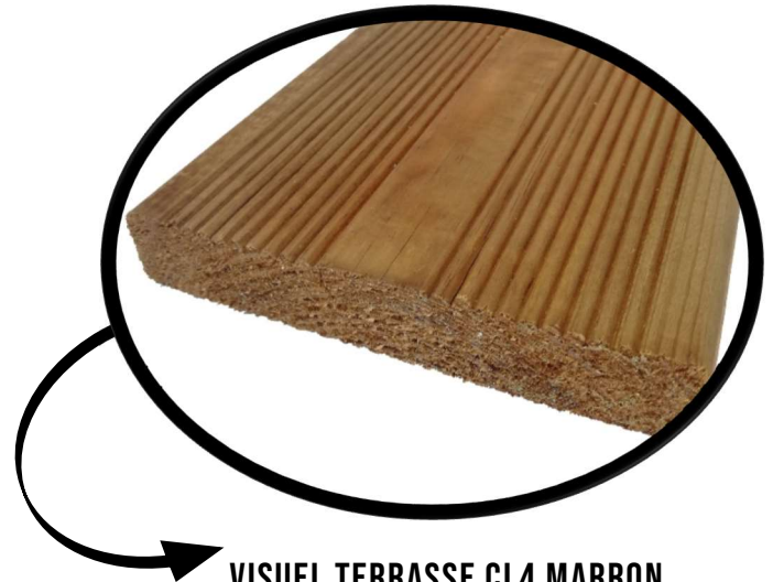
VISUEL TERRASSE CL4 MARRON